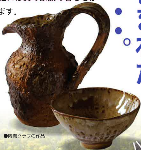
●陶芸クラブの作品